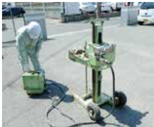
【スウェーデン式サウンディング試験】

この試験は、静的貫入試験の一種で原位置における土の貫入抵抗を測定し、その硬軟または締まり具合、あるいは土層の構成を判定するために行ないます。