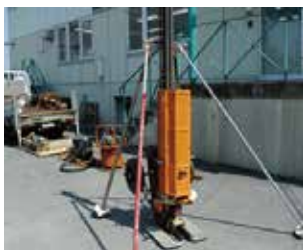
【オートマチックラムサウンディング試験】

通常のボーリング調査には堀削深さが50m～100m程度の能力のボーリングマシンが使用されます。