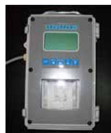
ミキシングテスター