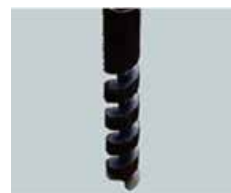
SSドリル（土質サンプラー）